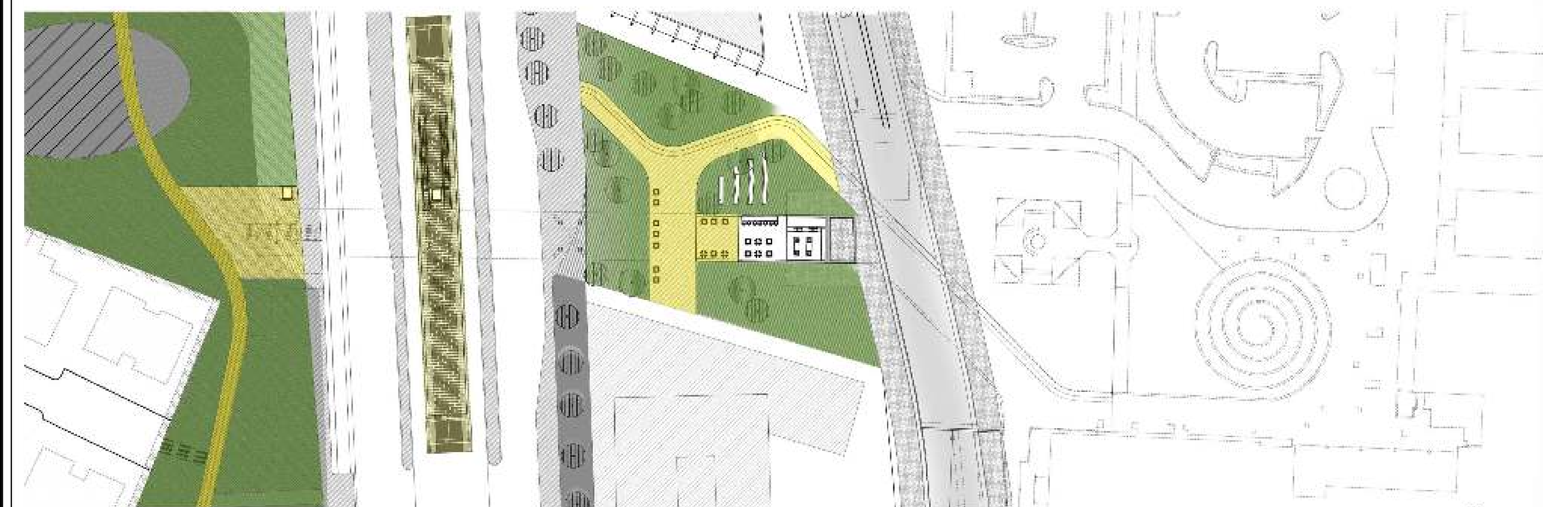
תכנית מפלס רציף | קב"מ 1:500 ⊕